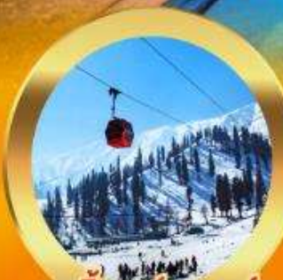
เคเบิลคาร์ กุสมาร์ค